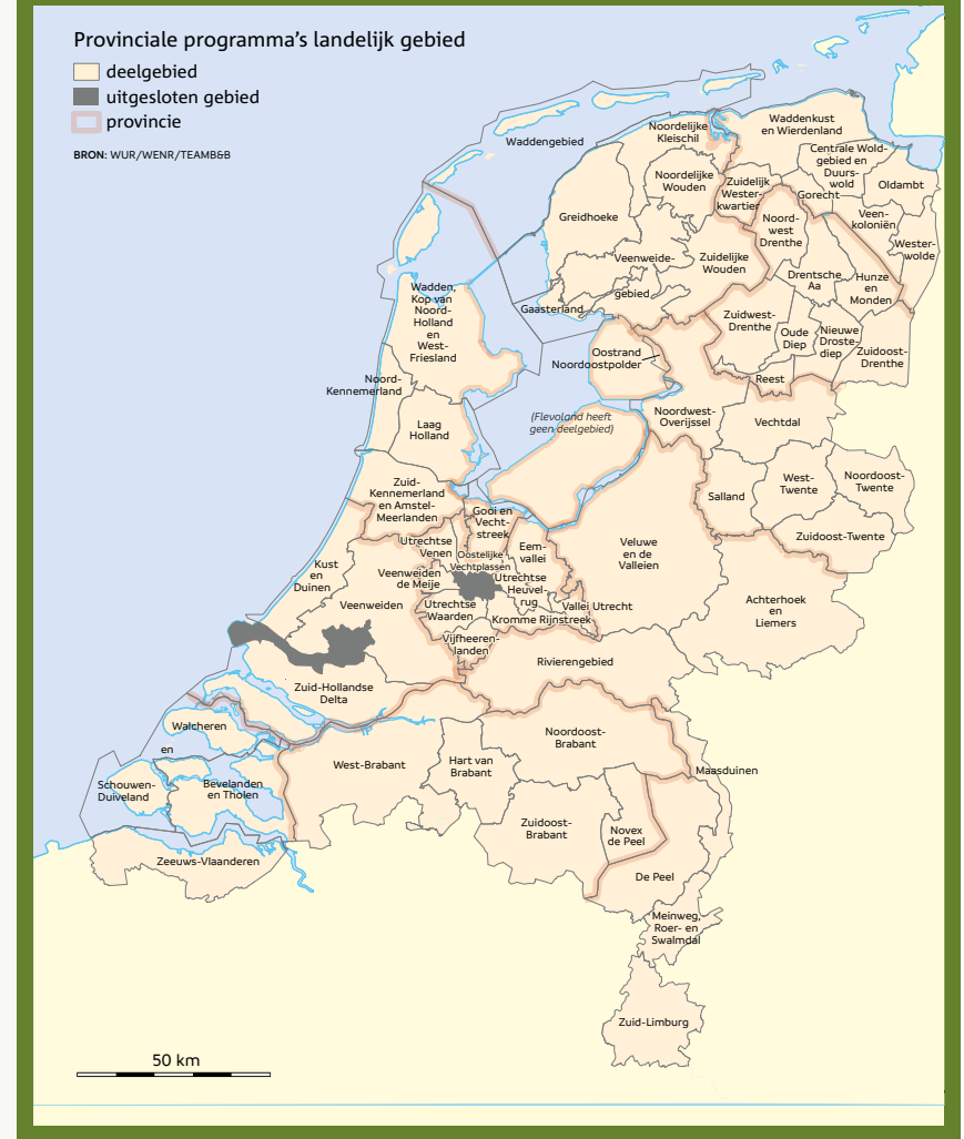
Figuur 1 Deelgebieden genoemd in de provinciale programma's (PPLG)