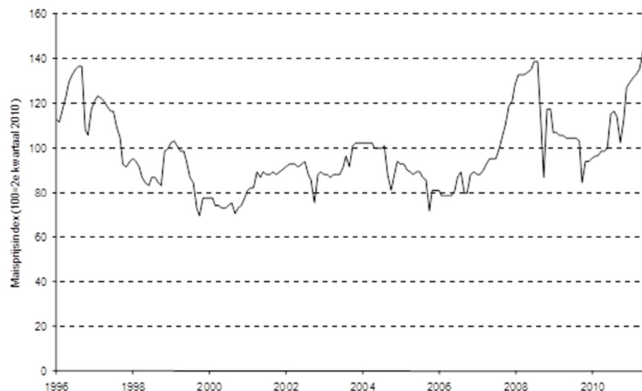
Figuur 1: Geïndexeerde maïsprijzen 1996-2012 gebaseerd op prijzen van het LEI, index=100 voor het tweede kwartaal van 2010

Om te voorkomen dat jaarlijkse schommelingen grote invloed krijgen op de berekende basisbedragen, is uit de marktconsultatie van 2010 naar voren gekomen dat een langjarig gemiddelde als uitgangspunt wenselijker is. Om te corrigeren voor