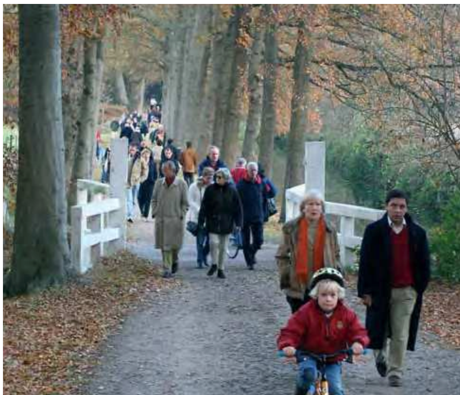
Stedelingen missen vooral rustige bos- en natuurgebieden in de nabijheid van hun stad.