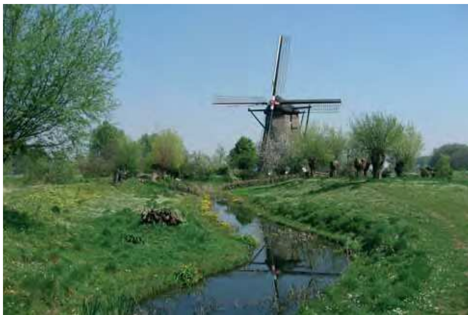
Nederlanders waarderen natuurlijke landschappen met een historische uitstraling het hoogst.