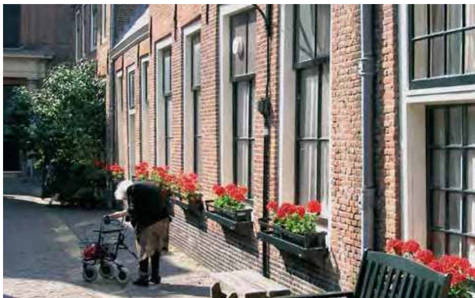
Groen in de directe omgeving is zeer belangrijk voor de waardering van het groen in de buurt.