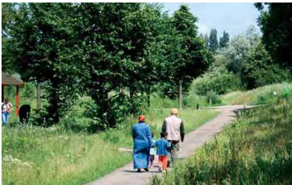
Allochtonen maken minder gebruik van het groen en waarderen het minder.

Vinex-wijken ontbreekt vaker het groen in de straat en liggen de parken en bossen verder weg. Bewoners zonder voortuin, zonder groenstroken of bomen in de straat of met een ander uitzicht vanuit de woning dan op groen of water zijn duidelijk minder tevreden dan gemiddeld. De hoeveelheid grote openbare groengebieden in de buurt, zoals parken, bossen en recreatiegebieden draagt minder bij aan de verschillen in tevredenheid van bewoners. Maar de nabijheid van dit groen is wel belangrijk. Verder zijn stedelingen matig te spreken over de speelmogelijkheden in het buurtgroen en de onderhoudstoestand van het groen. De helft van de bewoners van binnensteden geeft aan dat speelmogelijkheden in het buurtgroen ontbreken.