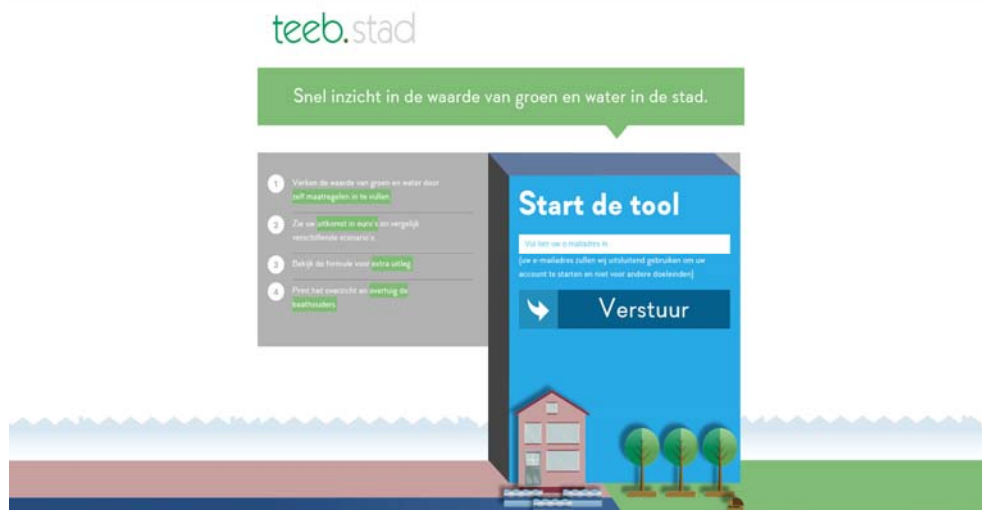
Figuur 1: De openingspagina van de TEEB-Stad tool ( www.teebstad.nl )

Dit digitale instrument – dat de opvolger is van de op de MKBA-methodiek gebaseerde eerste fase van het TEEB-stad project – is de TEEB-Stad tool gedoopt. Bij de ontwikkeling ervan waren verschillende organisaties betrokken, namelijk: Ministerie van Economische Zaken, Platform31, Fabrique, LUZ architecten, Buck Consultants International, Branchevereniging VHG/Productschap Tuinbouw, Gemeente Apeldoorn, Gemeente Delft, en De Vitale Groene Stad/Entente Florale. 2