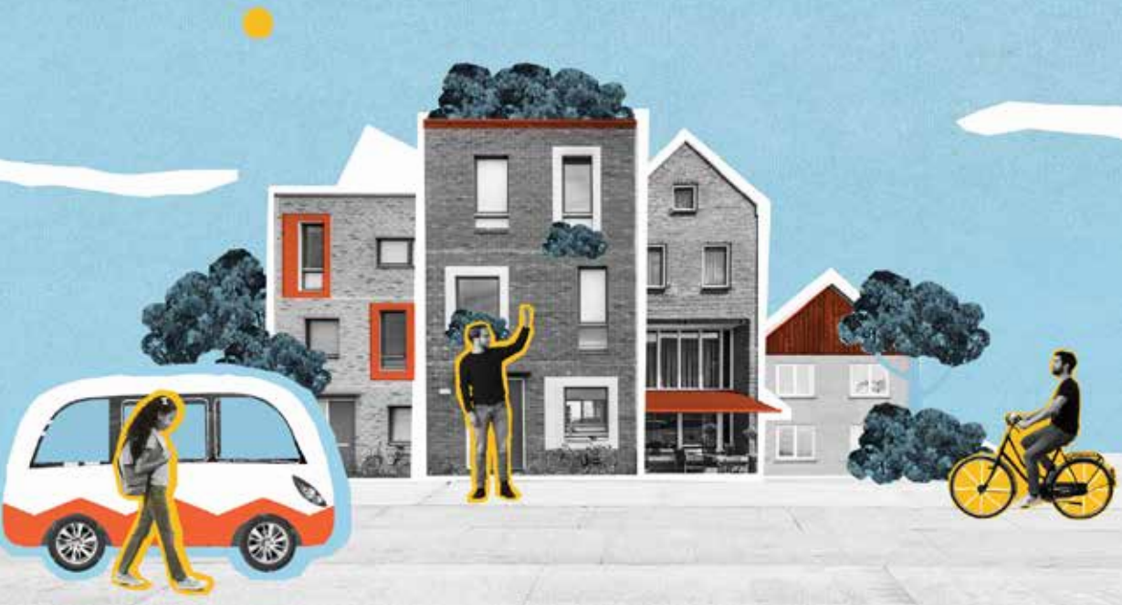
Eigenwijk. BRON PBL

verder vorm te geven. In Eigenwijk zijn het de buurtbewoners zelf die de inrichting onder handen nemen. Ze vergaderen over wensen en ontwerp, leggen geld bij elkaar en dragen in natura bij aan de totstandkoming van een plan (uren, materialen). In Beursplein nemen bedrijven het voortouw. Dat is ook te zien. Op geselecteerde plekken zien zij wel brood in een leefomgeving van hoge kwaliteit. Er valt immers goed te verdienen aan een hoogwaardige openbare ruimte in dure woonwijken en aan natuurgebieden waarin de beleving van de betalende bezoeker de ruimte krijgt. Alleen in Bubbelstad voelt vrijwel niemand zich geroepen om te investeren in een aangename of op z'n minst goed geordende openbare ruimte. Ook dat is te zien, als je tenminste opkijkt van je scherm.