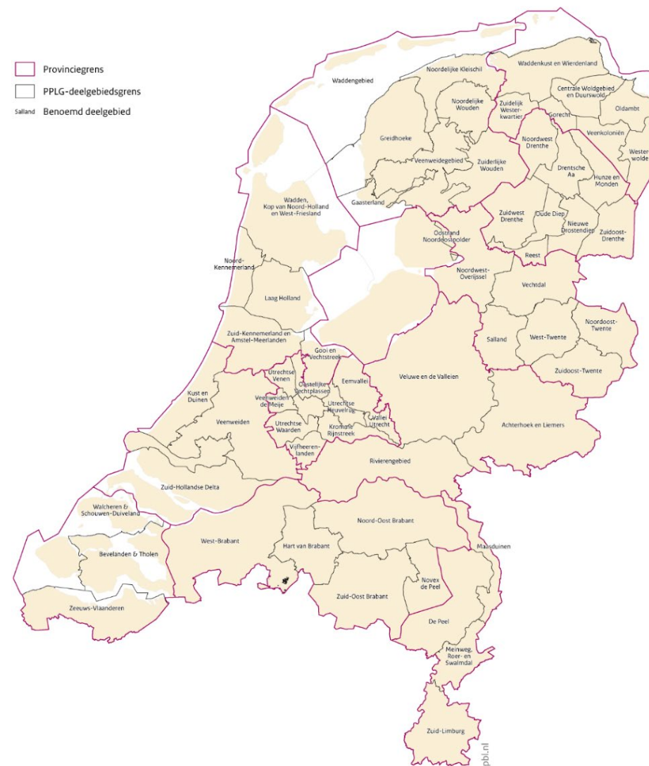
Deelgebieden benoemd in Provinciaal Programma Landelijk Gebied