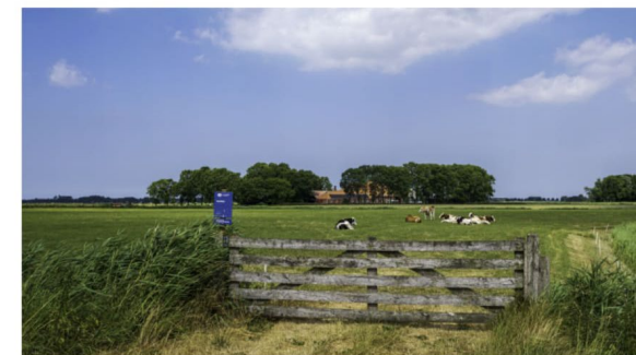
Een weiland met koeien in de voorzomer van 2023, langs het Reitdiep in Groningen.

De provincies willen in gesprek met het rijk over extra landelijke maatregelen vanuit Den Haag. De